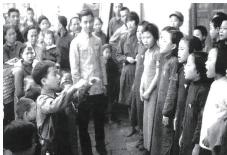
抗战期间，湖大学生在辰溪街头教唱爱国歌曲。

音乐家张曙组织起了长沙歌咏队，男女队员达2000余人。他们深入伤兵医院、难民收容所、各地民众训练班热情演唱和教唱《义勇军进行曲》《我的家在松花江上》等抗日救亡歌曲。