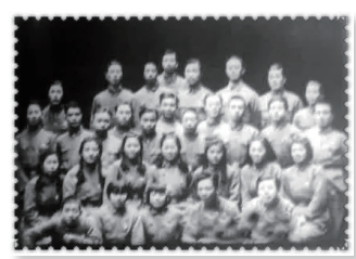
抗敌演剧八队在长沙合影。

1938年3月8日妇女节，省妇工委在长沙城中心的中山堂组织了一次大型纪念会，到会妇女2000余人。她们发表抗日演说，举行火炬游行，高唱抗日救亡歌曲，激发起空前的抗日热情，引发了一波参军护国热潮。当时，仅浏阳一县，一周内就有1000多人报名参军。