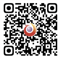
扫一扫, 看获奖代表感言