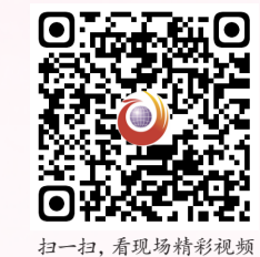
扫一扫, 看现场精彩视频