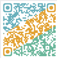
扫一扫，参与网友讨论

元宵节近在眼前，春节就要过完了。在各地“就地过年”的号召下，这个新年有了跟往年不一样的风景。响应“就地过年”的人有多少？据央视报道，多部门统计，今年全国大约有1亿人就地过年。而“高德打车”数据显示，春节期间（2月12日~2月15日），一二线城市打车活跃度较去年同期增长6倍；酒店订单同比增长37.3%，一二线城市景点、商场等相关地点的日均搜索量同比增长391%。