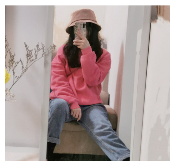
海南姑娘小蔡在长沙完成一次跨年自拍。

二爬岳麓山，初三看电影……“往年过年，听朋友说长沙城里还是挺冷清的，但今年不同，热热闹闹，欣欣向荣”。