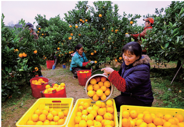
“姐姐出手，‘橙’心相约”巾帼助农柑橘销售特别活动。

1月19日，省委省政府相关领导对省妇联“姐姐”系列活动作出批示，高度肯定省妇联发挥组织作用为脱贫攻坚作出贡献，鼓励全省各级妇联组织在乡村振兴中彰显“半边天”作为。