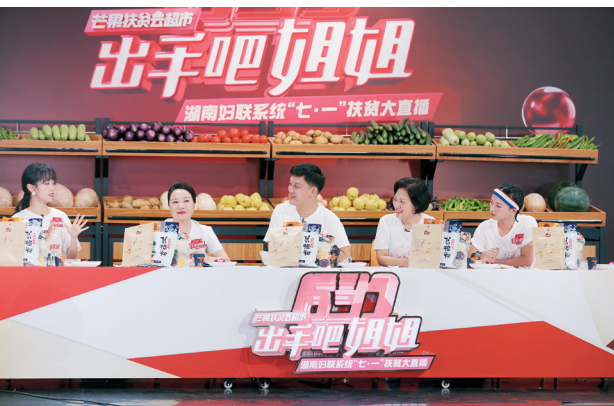
“出手吧，姐姐！”湖南妇联系统“七·一”扶贫大直播活动。