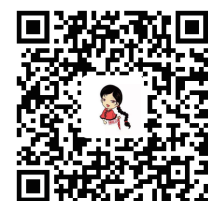
扫一扫，为她们点赞