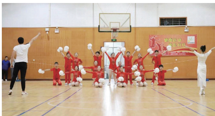
台上一分钟，台下十年功。台下，老师用手势将音乐传递给孩子们；台上，孩子们将震撼人心的表演传递给观众。