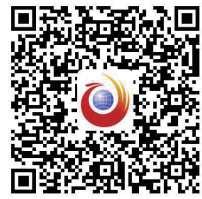
扫一扫，看更多专栏日记

侗族男子的服饰相对于女子来说，显得简朴、大方。他们在头上用青布包头；上身穿着立领的对襟上衣，外罩无纽扣的短坎肩，衣襟等处有绣饰；腰间系传统的侗族腰带；下身穿长裤，裹绑腿，穿草鞋或直接打赤脚。