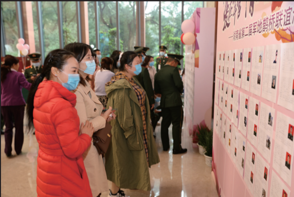
女嘉宾在资料墙前“围观”。