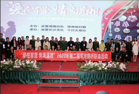
联谊活动取得圆满成功。