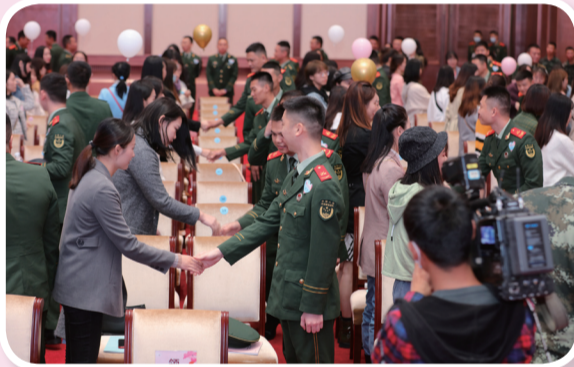
鹊桥联谊的重头戏——握手初印象。