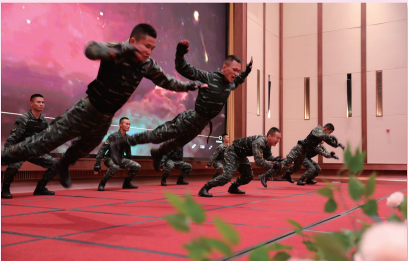
武警官兵带来精彩的军体拳表演。