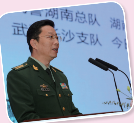
武警湖南总队副政委彭东亮