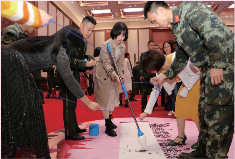
“善武”的兵哥哥们也“善文”，书法、投壶游戏样样行。