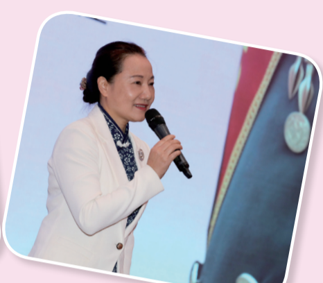
湖南省妇联党组书记、主席姜欣

铁骨铮铮，是你！含情脉脉，是你！10月18日，由武警湖南总队、湖南省妇联主办，武警长沙支队、今日女报/凤网承办的“爱在军营，情满潇湘”湖南省第二届军地鹊桥联谊活动在长沙九所宾馆举行。