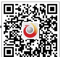
扫一扫，探寻更多的长沙“深夜食堂”

夜色里，沿着韭菜园一路向南，更多隐没在繁华都市角落的“深夜食堂”一一显露真容：南门口的美食城寨，高正街的盟重烧烤，裕南街的正街香肠……一路走来，你不得不感叹：如此美食，不可辜负啊！