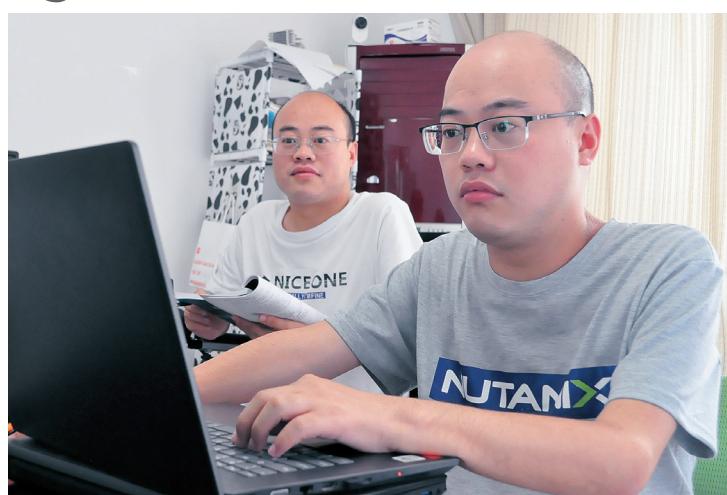
▲2017年，兄弟俩在长沙会合，工作上互相支撑，生活中互相照顾。