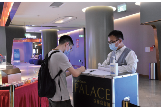
入场先登记姓名、电话、详细住址，疫情防控不大意。