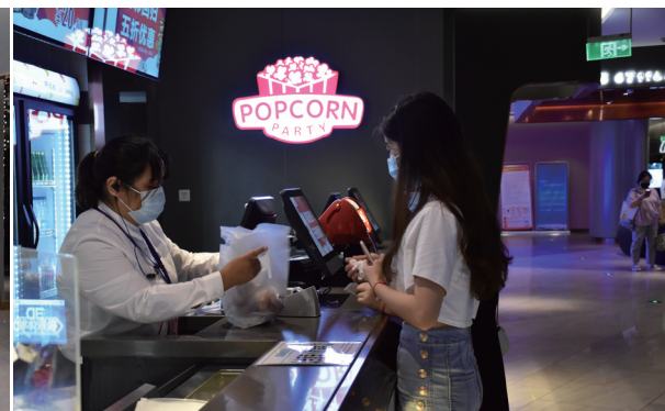
食品需要寄存在前台，电影、爆米花加可乐的乐趣，晚一点再享受。