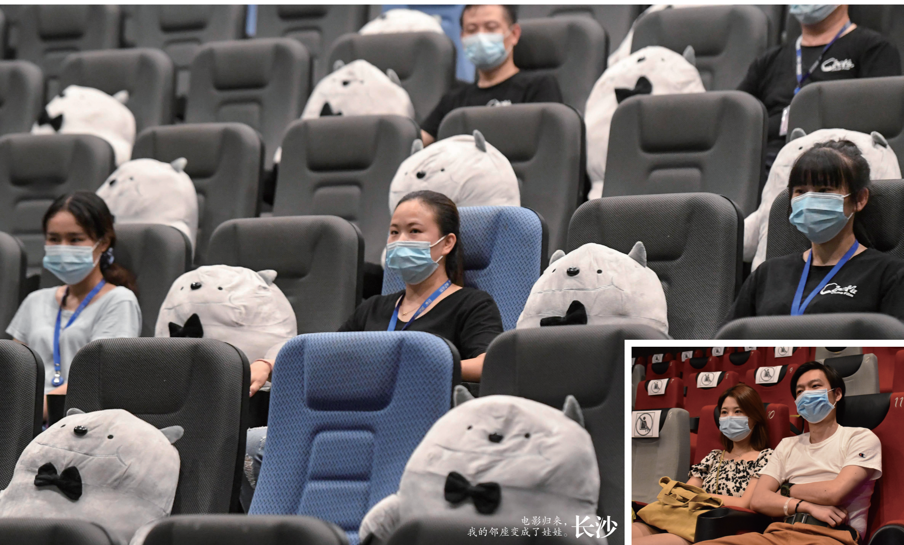
电影归来，我的邻座变成了娃娃。长沙