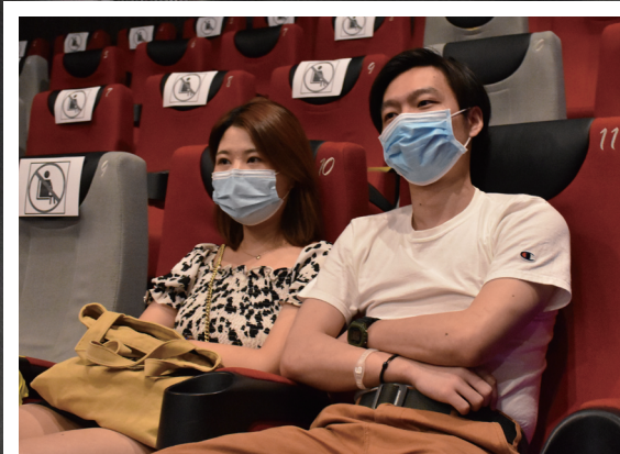
长沙 上影院观影，也对你上瘾。