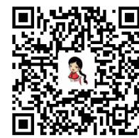
扫一扫,看三八红旗手风采

据悉,三八红旗手(标兵)、集体的评选始于1960年,是妇联组织授予优秀女性(及优秀女性群体)的最高荣誉,是激励广大妇女群众见贤思齐、创造业绩的重要工作载体和品牌,具有高度的社会影响力和群众公信力,深受社会各界和广大妇女群众的欢迎。60年来,一批又一批杰出的女性和集体获评三八红旗手(标兵)、集体,成为广大妇女群众向上看齐的标杆和榜样,成为推动社会文明进步的重要力量。为了彰显这种荣誉感,强化激励示范效应,省妇联今年特地开展送奖到基层到岗位活动,把奖章奖牌和证书送到获奖者手中。