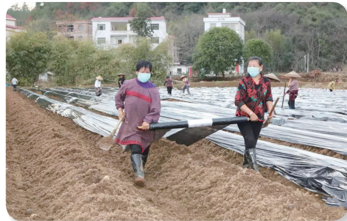
2月13日，在宁远县湾井镇梅子窝村，农民在盖地膜。

而她们在出工前，都测了体温，戴了口罩。湖南省康德佳林业科技有限责任公司董事长欧阳瑶介绍，自2月10日复工以来，无论是种植基地，还是加工基地，公司都加强了防疫措施，对基地进行了严格的消毒，对复工的员工监测体温，干活的时候全程佩戴口罩，注意保持距离，确保人员不扎堆、不聚集，“员工们都很乐观，撸起袖子加油干”。