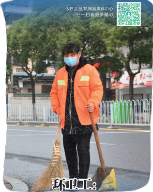
环卫工: 工作变“轻松”,心情不轻松

2月4日,立春。春始万物生。我们记录了多位长沙“城市罩顾者”的身影,用另一个角度见证抗疫一线。我们相信,这当中的每一个身影,都会让你感受到平凡中的伟大。