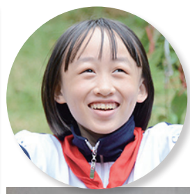
石上 12 岁 作品：《等“妖”三角形》 “我用《西游记》里除妖降魔的故事，创意了这幅画，我相信我们强大的祖国一定想办法像降魔一样打赢这场战‘疫’。”