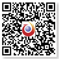
扫一扫，看精彩视频

湖南省文化和旅游厅艺术幼儿园的孩子们则一起创作了一首优美的 MV。“你问我家乡哪最美，湖南第一不是吹，旅游景点一大堆，星城长沙是省会……”“我是文旅幼恬小妹，对抗病毒我也会，七步洗手多喝水，戴好口罩不聚会……”在这则 2 分多钟的视频里，一位扎着羊角辫的小女生跟着音乐节拍，用甜甜的声音唱出家乡湖南的美景、讲述近期身边发生的温暖故事、介绍正确的防疫知识。孩子和家长们共同入镜，为祖国加油，为所有人打气。