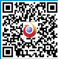
扫一扫，看更多精彩内容

“在那山的那边海的那边，有一群蓝精灵……他们齐心协力开动脑筋，斗败了格格巫，他们唱歌跳舞快乐又欢欣。”听着这首《可爱的蓝精灵》，你是否会觉得，蓝精灵就像我们身边化解矛盾纠纷的人民调解员。他们齐心协力开动脑筋，打败“矛盾纠纷”这个“格格巫”，维护着一方安宁。这其中，建立在湖南与相邻6省（区市）边界的人民调解委员会（以下简称“调委会”）和穿梭在省际边界的人民调解员（以下简称“调解员”），更像是“蓝精灵”中的“跨界”调解达人，他们面对往往涉及两省（区市）的“矛盾纠纷”，妙手送出，为实现边界地区长期和谐稳定，建设平安中国、法治中国做出了贡献。