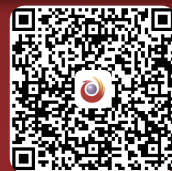
扫一扫,分享三八红旗手时代风采