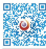
扫一扫，分享好故事

14所国内重点高校选拔选调生到乡镇基层锻炼起，已有100余名定向选拔博士生回到了基层，“我相信大家的想法都是一致的，希望将自己学到的知识真正运用到基层工作，更快地带动基层发展！”