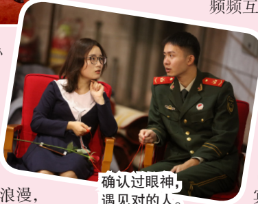
确认过眼神,遇见对的人。

为加深青年男女间的了解,联谊会现场设置了拜月仪式、月老抽选配对、自我介绍、互动游戏、自由沟通等5个环节。在游戏互动中,男女青年“比翼双飞”双人夹气球,“心有灵犀”双人猜爱情成语,“情投意合”网兜接彩球……“兵哥哥”一展才情,与女嘉宾频频互动,留电话、加微信,现场气氛热烈,爱的火花不断迸发。