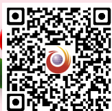
扫一扫,看更多现场有爱瞬间