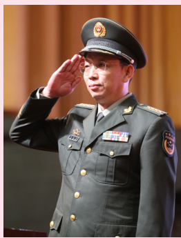
彭东亮 (武警湖南总队副政委)

武警湖南总队主要担负着执勤处突、反恐维稳和抢险救援等任务,官兵们立足本职、敬业奉献,为维护湖南社会稳定和长治久安、促进驻地经济繁荣发展作出了积极贡献。其中,不少优秀青年官兵一门心思扑在工作上,没有更多精力顾及个人婚恋问题。通过举办此次联谊活动,不仅能架起部队官兵和地方女青年之间“爱的桥梁”,为青年官兵走进社会、展示风采提供良好机遇,也为地方女青年更多地了解军人、熟悉部队搭建平台提供了机会。参加本次活动的青年官兵,都是有本事、有品德的新时代革命军人,也是有追求、有柔情的热血男儿。希望这些优秀的青年男女在和谐、温馨、浪漫的氛围中收获爱情、收获幸福。