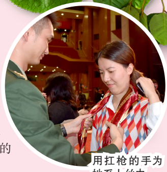
用扛枪的手为她系上丝巾。

最终,活动当天有18对青年男女成功牵手。右手敬礼,左手牵你,兵哥哥与湘妹子的爱情,让我们拭目以待!