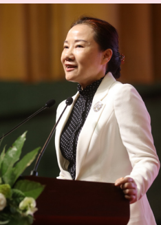
姜欣(湖南省妇联主席)

这次活动为军地青年男女搭建了相识、相知、相爱的良好平台,促进了军民共建,促进了社会和谐,打造了军民融合的良好局面。今天来到现场的女青年,有老师、有医生、有公务员等等,她们美丽与智慧并重,个性与格局并存,都是行业精英、业务骨干,都对军人充满敬意。2016年,湖南省妇联曾组织多名湘妹子前往甘肃酒泉卫星发射中心进行军地联谊,成就了十多对美好爱情。希望这次联谊会上能有更多青年男女收获爱情,在最美的年华遇见最好的他(她)。