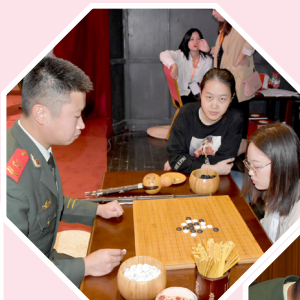
下围棋、写书法,合作“穿针引线”……兵哥哥能文能武,湘妹子有颜有才。

这次活动为军地青年男女搭建了相识、相知、相爱的良好平台,促进了军民共建,促进了社会和谐,打造了军民融合的良好局面。今天来到现场的女青年,有老师、有医生、有公务员等等,她们美丽与智慧并重,个性与格局并存,都是行业精英、业务骨干,都对军人充满敬意。2016年,湖南省妇联曾组织多名湘妹子前往甘肃酒泉卫星发射中心进行军地联谊,成就了十多对美好爱情。希望这次联谊会上能有更多青年男女收获爱情,在最美的年华遇见最好的他(她)。