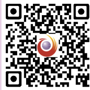
扫一扫,分享武警湖南总队的“红娘心得”

为了这次兵哥哥和湘妹子的邂逅(相近),武警湖南总队政治工作部人力资源处、武警长沙支队政治工作部人力资源科的干部们忙前忙后,又是当“红娘”,搜集整理男女青年的个人资料,又是建微信群让大家先“预热”……如此操心兵哥哥终身大事的背后,是一颗颗有爱关注的心。