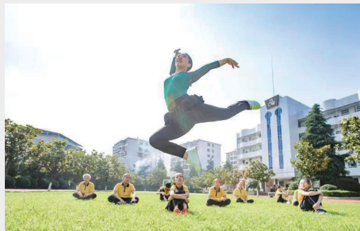
在这里当舞蹈老师，一般的舞者难以胜任。