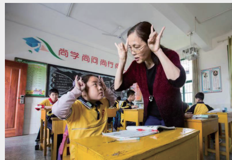
手语教学，看看我们多默契。