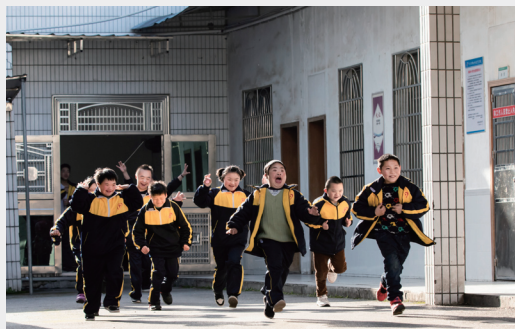
去操场玩游戏，冲呀！