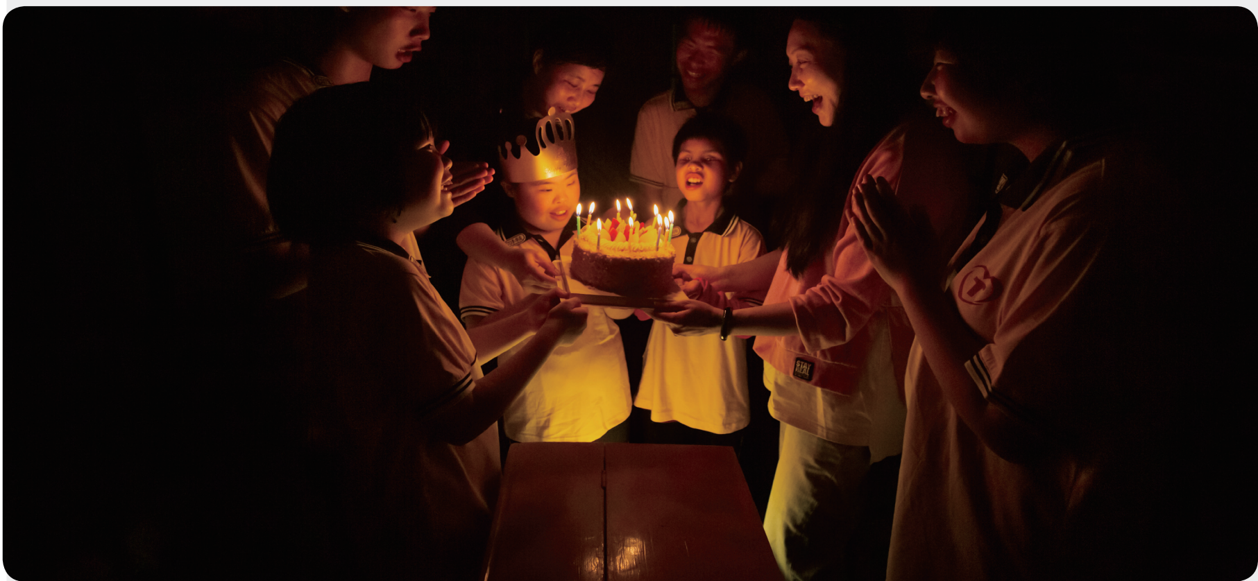
不错过每一个孩子的生日。