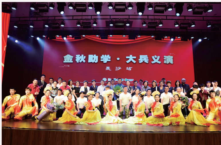
2019 年“金秋助学 大兵义演”圆满落幕。活动所获得的善款，将主要用于资助湖南省已收到 2019 年中考、高考录取通知书的贫困家庭学生和湖南边远山区校园艺术教育服务。

湖南省妇联副主席卢妹香告诉今日女报 / 凤网记者，希望能通过“金秋助学 大兵义演”这样的群团组织 + 政府部门 + 公益基金会募捐 + 名人义演这样的形式，统筹各方资源，帮助更多像小钟这样的贫困学子早日圆学业梦，靠他们自己的双手改变自己 and 家人的命运。