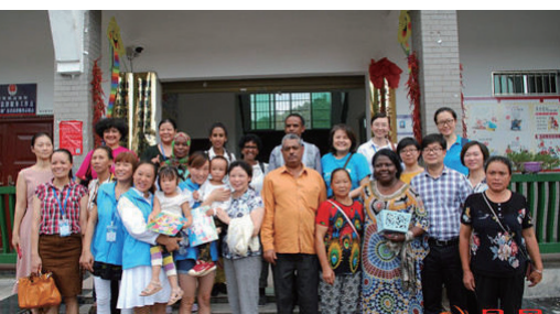
来自外国的政府官员考察团在湘潭县探寻ECD项目。