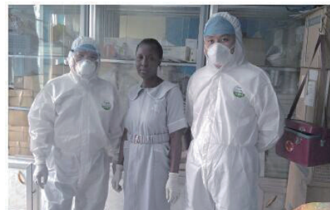
湖南医生在塞拉利昂教会当地护士不少真本领。

中国妇幼健康宫颈病变援津巴布韦项目湖南医疗援助队的队长……他们被称作“离非洲病毒最