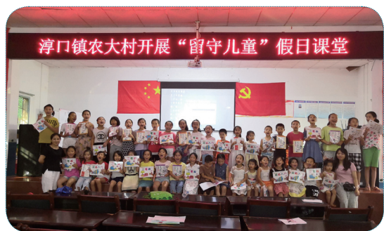
浏阳市淳口镇农大村儿童之家暑期夏令营

儿童之家的诞生，正是源于社会对校外教育公平的关注。学龄儿童，一年中大概有 180 天的时间在校学习，另外 180 天的时间在家庭和社区度过。建立起城乡社区的儿童之家，就像织就了一张细密的儿童保护与发展的大网，精准地将国家关怀及时送到儿童和家庭身边，打通社区为儿童和家庭服务的“最后一公里”。尤其对于困难家庭，农村留守儿童的身