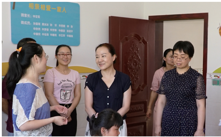
姜欣一行在邵东县火厂坪镇龙新村村民申亚军家调研留守儿童关爱服务试点工作。

在随后的调研座谈会中, 邵东县妇联汇报了试点工作以来该县留守儿童工作进展, 邵阳市家庭教育研究会汇报了邵东县留守儿童智慧关爱系统的建设情况。姜欣希望邵东的留守儿童关爱服务工作