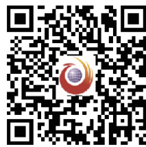
扫一扫，参与网友讨论