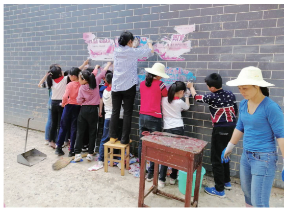
每天一大早，“草帽姐”们就集合，开始清洁工作。

在执委们的号召下，一支30余人的“草帽姐”队伍成立了。“草帽姐”们不仅在村域内对“牛皮癣”进行大清除，还负责劝导村民清扫房前屋后的垃圾，整齐摆放生产、生活杂物。如今古村落已经旧貌换新颜。