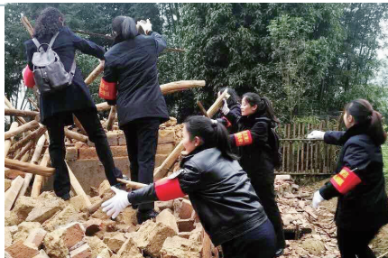
妇联主席带头，“巾帼先锋队”为贫困户拆除偏杂屋。