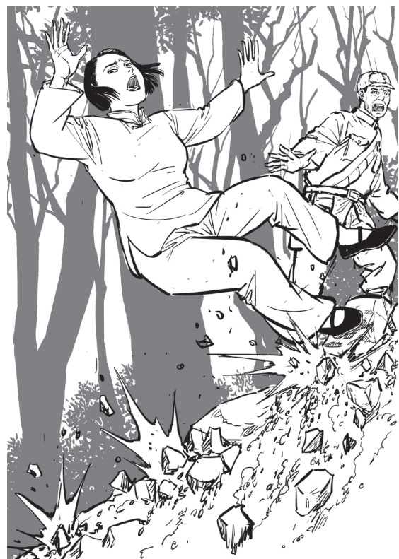
为掩护战友，杨展不慎从悬崖掉落。

1949年8月5日，杨展的家乡湖南长沙和平解放。杨展的父母也一直在等待女儿的归来，直到10日才等到毛泽东的一封电报：“展儿于8年前在华北抗日战争中为国光荣牺牲。她是百万牺牲者之一，请你们不必悲痛。”