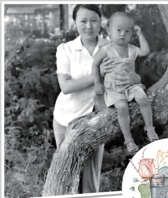
那时候，妈妈好高高。