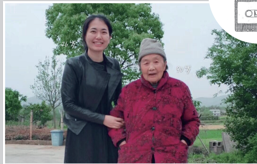
这一年，我26岁，奶奶90岁。