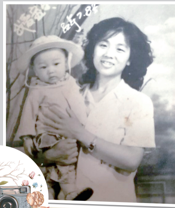
小时候，妈妈总把我抱在怀里。