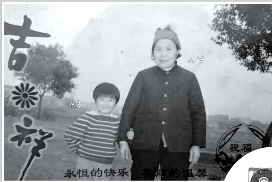
那一年，我4岁，奶奶68岁。

摄影界有句话，最朴素的影像往往最有力量。果真如此的话，希望今天这组图片的力量落在“加倍让一天天变老的她（他）感知到更多的温暖”。就如同王帆在演讲中所言：龙应台有一篇《目送》，她在结尾告诉我们，不必追。可是今天我想告诉大家，我们就得追，而且我们要从今天开始追！提早追！大步追！因为至亲至情，不应该是看着彼此渐行渐远的背影，而应该是你养我长大，我陪你变老。