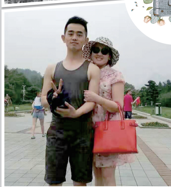
现如今，我已比妈妈高出一个头。