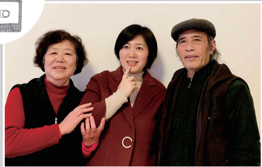
现在，我总希望爸妈慢点变老。