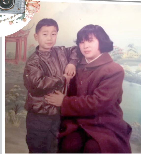
这才几年呀，妈妈就抱不动我了。