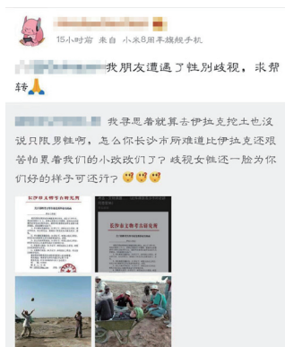
以上学历，研究方向为隋唐宋元考古或者陶瓷考古，男性。”

该学生向记者提供了一份图片版的招聘文件，名为《长沙市文物考古研究所关于招聘考古等专业优秀毕业生的函》。文件提到：“我所系副县级财政全额拨款事业单位……拟面向全国招聘考古等专业优秀毕业生，请贵单位推荐或请学生直接与我所联系，具体招聘计划如下：1、考古勘探发掘岗位：35岁以下，本科及以上学历，考古学专业，如为研究生，则倾向于研究方向为秦汉考古，男性。2、考古勘探发掘岗位：35岁以下，研究生及