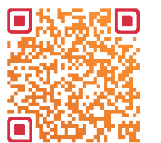
扫一扫，参与网友讨论

该学生向记者提供了一份图片版的招聘文件，名为《长沙市文物考古研究所关于招聘考古等专业优秀毕业生的函》。文件提到：“我所系副县级财政全额拨款事业单位……拟面向全国招聘考古等专业优秀毕业生，请贵单位推荐或请学生直接与我所联系，具体招聘计划如下：1、考古勘探发掘岗位：35岁以下，本科及以上学历，考古学专业，如为研究生，则倾向于研究方向为秦汉考古，男性。2、考古勘探发掘岗位：35岁以下，研究生及