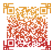
扫一扫, 看福猪送祝福