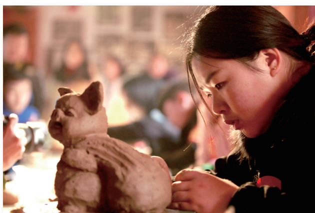
女工艺师创作的福猪充满着喜庆与欢乐。