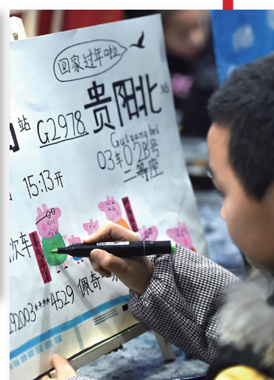
春节, 在孩子们眼里就是回家过年。在贵州省遵义市, 一个小朋友为爸爸画了张“佩奇”车票, 希望爸爸能赶快回家。