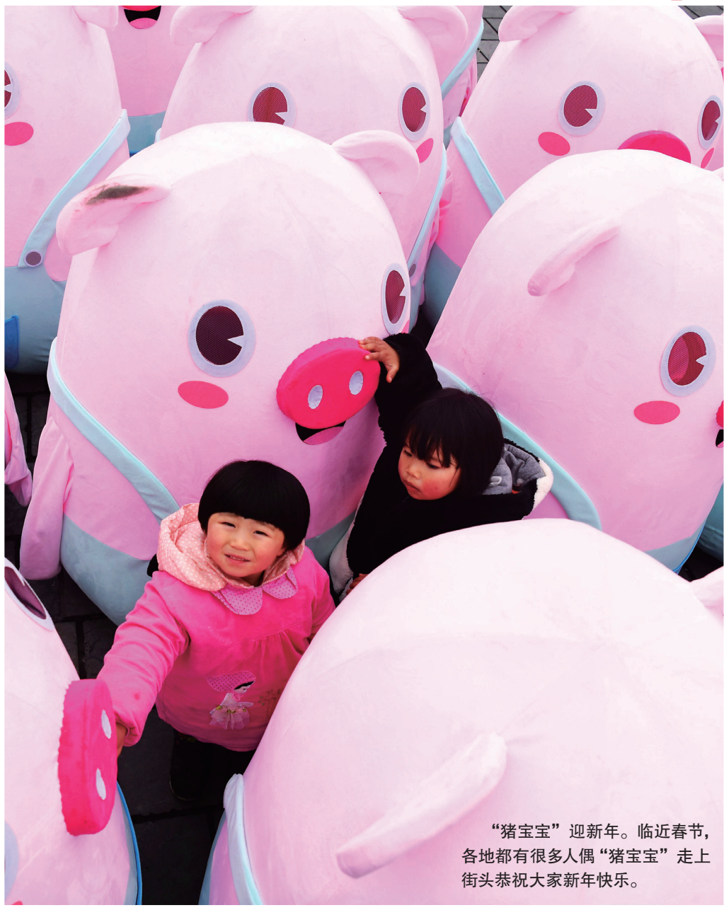
“猪宝宝”迎新年。临近春节, 各地都有很多人偶“猪宝宝”走上街头恭祝大家新年快乐。