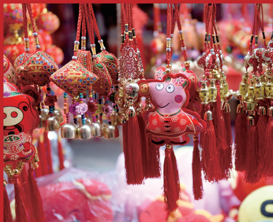
年货市场, 各种“小猪佩奇”年货闪亮登场。