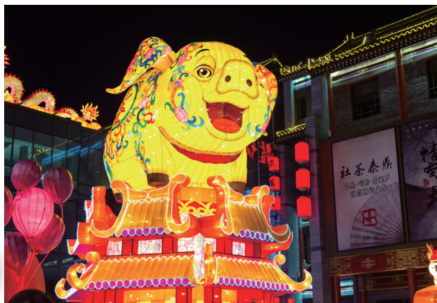
每年都有新春花灯会, 今年巨型金猪花灯毫无悬念地最耀眼。