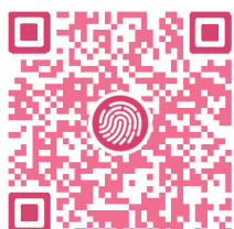
扫一扫，看这场贺岁档“演唱会”谁最强

这么多明星加盟，贺岁档就像新年演唱会一般热闹，而哪部电影最好看主题曲里也藏着玄机。