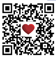
扫一扫, 看微信头像对相亲的影响

在网络时代, 头像就是我们的第一张脸, 在没见到真人之前, 我们会通过头像来猜测对方的爱好甚至性格。相亲中, 大部分人也已经习惯用头像去猜测屏幕后的另一方是个什么样的人。听到以下几位相亲小伙伴的经历, 不得不承认, 微信头像真的会影响别人对你的第一印象。有些看起来很辣眼睛的图片, 别说是和你谈恋爱, 连和你聊天的欲望都没有。