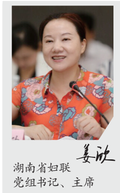
姜欣 湖南省妇联党组书记、主席

11月21日，我到洪山桥社区宣讲，结束后大家都不愿离开，围着我，你一言我一语地讨论着刚刚宣讲会上的内容。因为我讲的是习近平总书记和党中央对妇女群众的关心关怀和期待，讲的是怎样才能做到自尊自信自立自强，讲的是如何在建功立业的同时