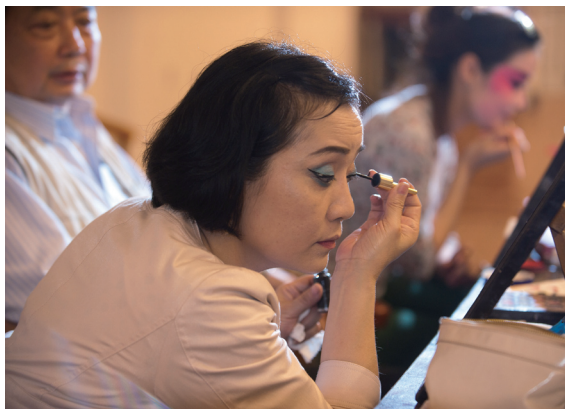
化妆，跟唱腔一样讲究。