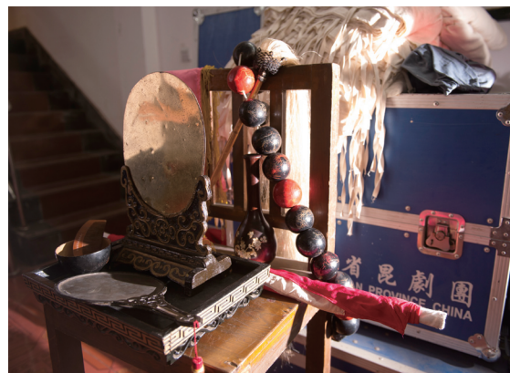
每一样行头，都有自己的故事。