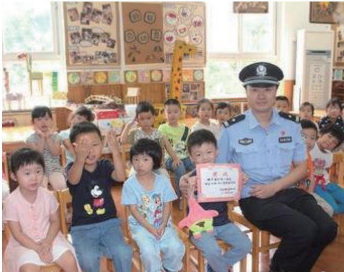
警察叔叔给恒恒颁发奖状。

“我在马路边捡到一分钱，把它交到警察叔叔手里边，叔叔拿着钱，对我把头点……”儿时经常哼唱的这首关于拾金不昧的儿歌，早已经淡出了我们的脑海。我们这代人小的时候，这首歌是教育的标配。如今看看，还有多少