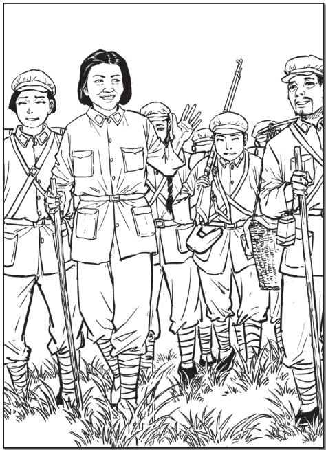
蔡畅是长征中年龄最大的女红军，在党内人们亲切地称她“蔡大姐”。她对待年轻一代就像对自己的子女一样关心爱护，人们又亲切地称她“蔡妈妈”。

蔡畅是红军长征年龄最大的女红军，中国妇女运动的领袖和国际进步妇女运动的著名活动家。全国妇联第一至三届主席、第四届名誉主席，第四、五届全国人大常委会副委员长，中共七至十一届中央委员。