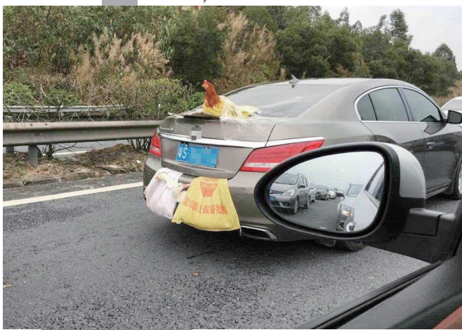
后置发动“鸡”。

今年6月13日，长沙市公安局交警支队开福大队在芙蓉北路段执勤时，发现一辆湘E车牌的白色小轿车后备箱上绑着两个纸箱子。