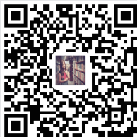
扫一扫，说说你挑到的错误

早在战国时期，就有因文字挑错而生的“一字千金”典故。给书籍悬赏挑错，作者需要有强大的自信，才敢承诺。那么挑错人又是如何给书籍“捉虫”的？今日女报/凤凰网记者找到了这些挑错人，解开了书籍差错背后的秘密。