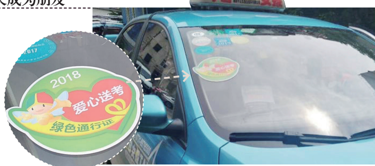
贴有爱心送考标志的今日女报出租车。