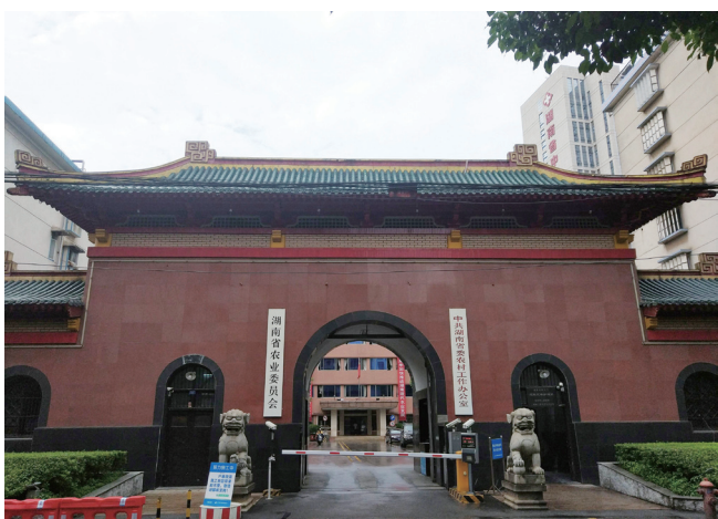
现在湖南省农业委员会所在地曾是湖南贡院。

康熙四十二年（1703年），潘宗洛督学湖广，为许多湖南士子因家境贫寒不得不放弃远途的乡试而感到惋惜。后来，潘宗洛任偏沅巡抚（雍正二年改称湖南巡抚），上任后的第一件事就是继前任赵申乔，再次上疏题请湖广乡试南北分闱。康熙五十五年，偏沅巡抚李发甲上疏恳请南北分闱。康熙五十九年，庚子科湖广乡试副考官吕谦恒上奏：“湖南文风日盛，远隔洞庭湖，理宜分闱，独立举办乡试。”