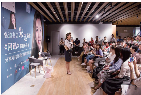
朱迅在长沙与粉丝互动。

年再聚，多人提到：‘现在中国留学生约10万人，在日华人70万，自杀率、犯罪率、抑郁症的发病率比我们在校时要高太多了。我们那时那么苦，现在条件这么好，孩子们是怎么了？’我把自己出国回国的心路历程和盘托出，就是希望能陪伴这些留学生，给他们鼓励。”