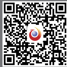
扫一扫，分享你的观点

到了 4 月 13 日和 20 日，湖南先后下发“文明节俭操办婚丧喜庆事宜”、“开展违反中央八项规定精神突出问题专项治理”工作方案，进一步严明纪律。如今，澧县新政已经推行一个月，究竟取得了哪些好的成效？近日，今日女报 / 凤网记者来到澧县，并深入社区和农村一探究竟。