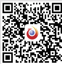
扫一扫，为老人们点赞

文：今日女报/凤网记者 吴迪 如今，在城市里的大街小巷，总能看到一群群精神矍铄的老年人，或者一起打拳，或者一起跳舞，或者一起唱歌，共度美好的晚年时光。但浏阳市有一群退休或下岗女工，组建了一个艺术团，不仅仅是自娱自乐，而且11年来，坚持到偏远乡村，为老人们表演节目，送去快乐。