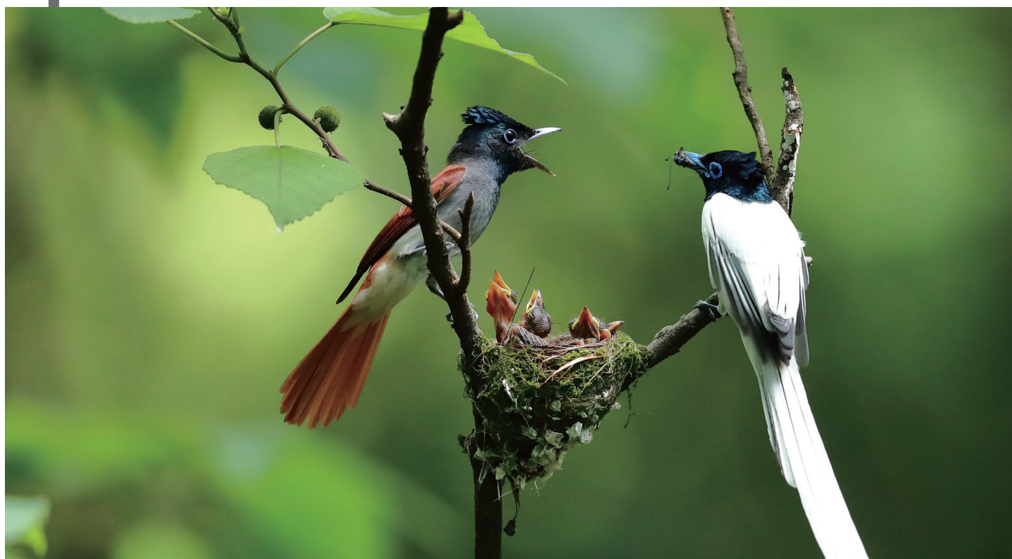
咱们绶带鸟的全家福，要的就是华丽。

那么，最后提醒一下，母亲节刚刚过去，父亲节又要来了，这么多温情的节日扎堆，别忘了告诉自己：我们要有归属感、幸福感，更要有责任感。