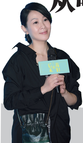
文：今日女报/凤凰网记者陈寒冰