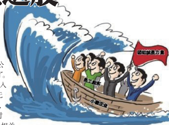
现在好多小企业也在推广员工入股。