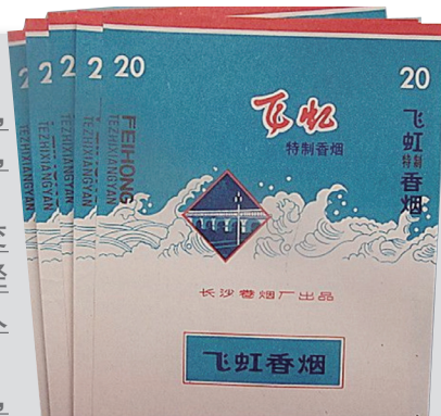
由长沙卷烟厂出品的烟标“飞虹”以现在的橘子洲大桥为主图。

所谓烟标，就是香烟制品的商标，俗称烟盒。那么，你随手扔掉的烟盒中，究竟是否值得收藏呢？