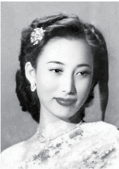
从开票员到电影明星的上官云珠。

鲁迅说，“悲剧就是把有价值的东西撕碎给人看”，当一个美好的东西活生生地在你面前毁灭，是何等的残忍和悲怆。在中国电影史上，著名演员上官云珠之死，便带给人们最残忍的悲剧感受。作为“新中国二十二大电影明星”之一，她的美丽曾让人不敢逼视，然而“文革”爆发后，她遭到残酷迫害，在黎明前最黑暗的一个凌晨跳楼自杀。她用死亡终结眼中的黑暗，换取最后的尊严。