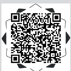
扫一扫，说说你的看法