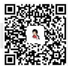
扫一扫,为她们投票

今日女报/凤网讯(首席记者 李立 通讯员 符靓)记者近日从湖南省妇联获悉,经过层层推荐、自荐,2017年度第二批湖南省城乡妇女岗位建功候选的先进集体(个人)名单已经出炉,从1月12日起,第二批候选的个人和集体已分类别在湖南省妇联官方微信公众平台“湘妹子”上接受全面公开投票。